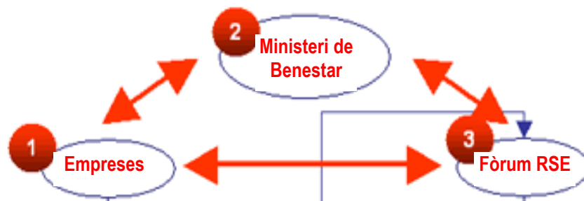
Figura 3: Pla del procés de les polítiques públiques