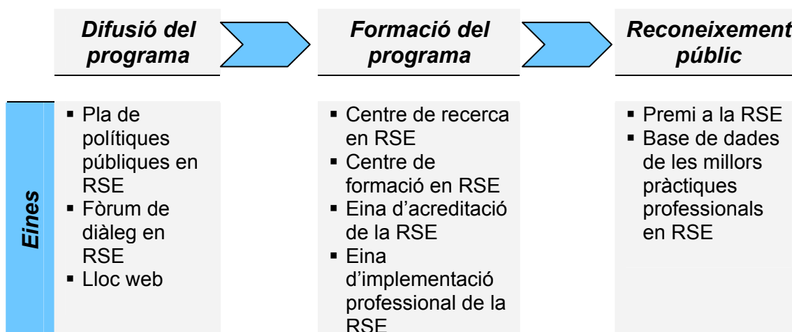
Figura 2: Procés i eines per a la implementació completa d'un programa de RSE

La difusió del programa a les pimes s'hauria de dur a terme per mitjà de la xarxa multi-stakeholder i d'una campanya pública, seguides d'un díptic informatiu en forma de guia completa del programa i de formació específica adreçada a pimes. El pas final, en aquest model ideal, seria una campanya pública i un reconeixement per a les pimes que completessin amb èxit el programa. Els onze programes que descrivim són representatius de les diferents eines que hem exposat aquí. Si bé la majoria dels governs només fan servir una eina o una altra, recomanem utilitzar-ne una combinació per tal de dur a terme un programa complet adreçat a pimes.