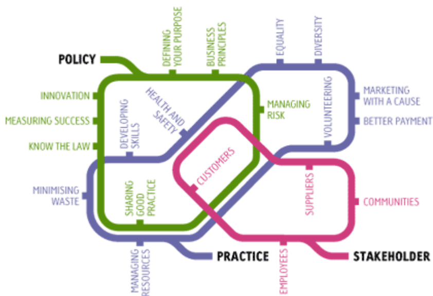
Figura 5: Small Business Journey