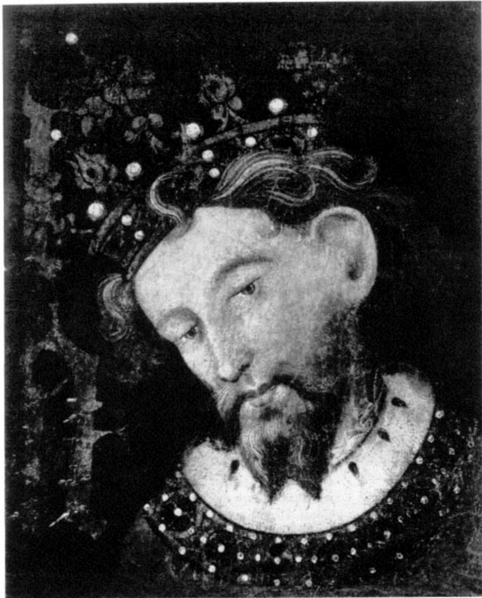
3. Ignoto (sec. XV), Ritratto di Giacomo I (?) . Barcellona, Museo d'Arte di Catalogna.

dents de diferents enquadernacions, de contingut litúrgic i jurídic i 12 procedents d'enquadernacions de còdex d'Arxiu amb contingut humanístic i musical. En aquest lot també figuren 3 pàgines en vitela procedents de llibres litúrgics del segle XV amb bones miniatures florals.