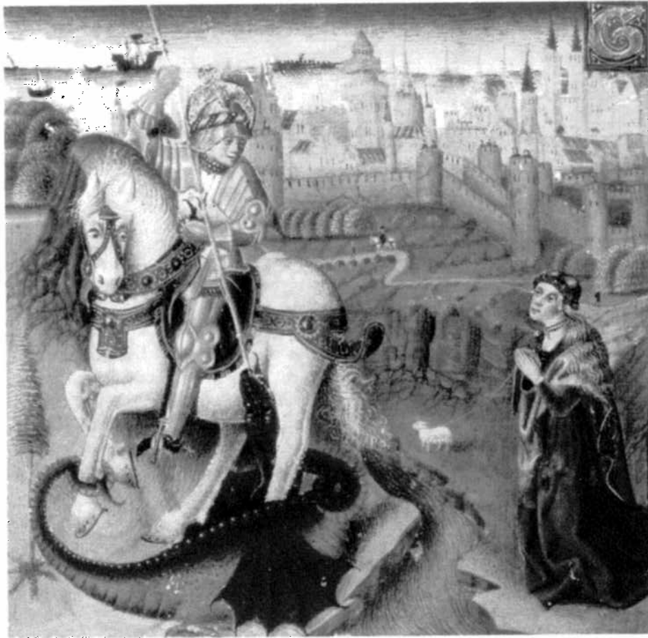
2. Libro d'ore di Alfonso d'Aragona. Napoli, Biblioteca Nazionale.