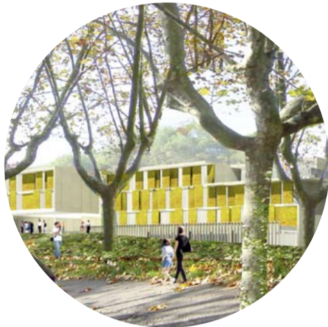
Zona Académica insertada en un pulmón verde que le aporta una excelente calidad de vida.