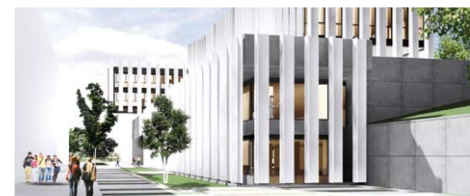
Edificio docente de ESADE