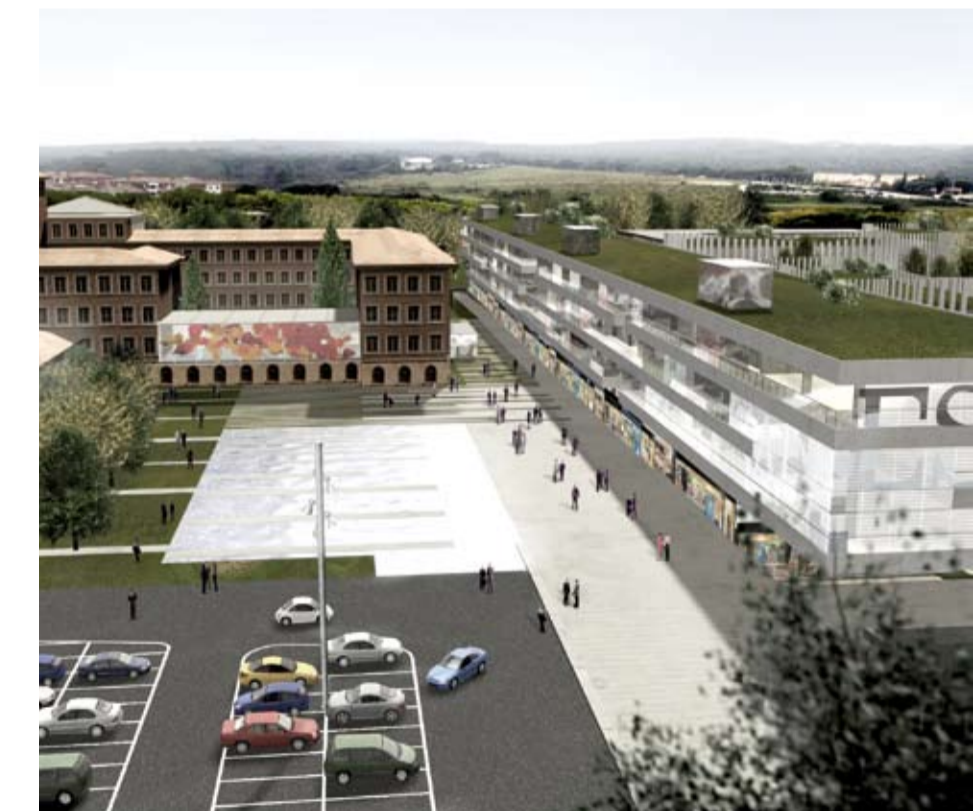
Vista de la entrada de la Residencia Club al lado del Edificio Creapolis